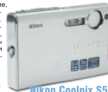
Nikon Coolpix S5

У этого Nikon-а отменный огромный ЖК-монитор с большим углом обзора. Больше не нужно будет, сфотографировав тусовку, передавать фотоаппарат каждому, чтобы посмотреть, как получился. Теперь все, человек двадцать, не будут биться лбами за вашей спиной,